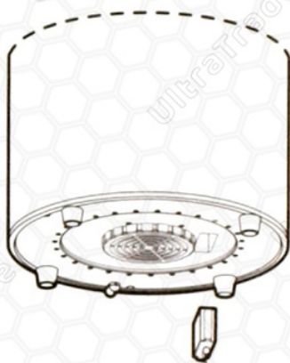
Лоток для ароматизатора

2. Срок замены ароматизатора: рекомендуется менять ароматизатор раз в три месяца.