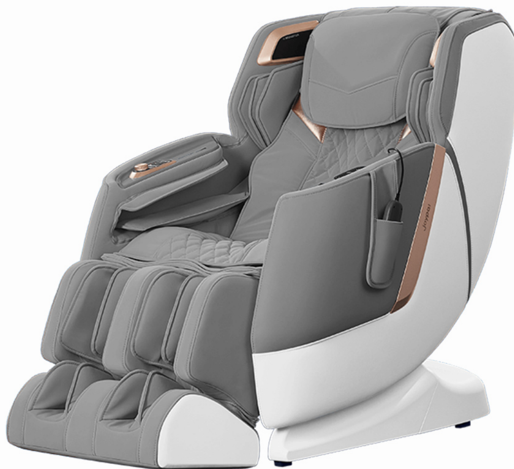
Массажное кресло Xiaomi Joyral Smart Massage Chair Magic Sound Joint Version Руководство по эксплуатации